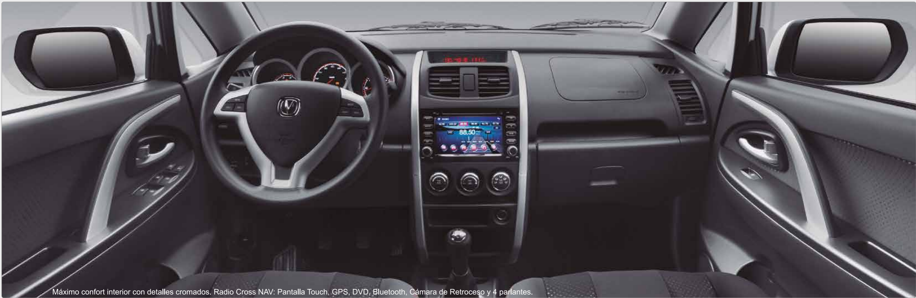
Máximo confort interior con detalles cromados. Radio Cross NAV: Pantalla Touch, GPS, DVD, Bluetooth, Cámara de Retroceso y 4 parlantes.