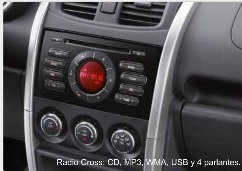
Radio Cross: CD, MP3, WMA, USB y 4 parlantes.