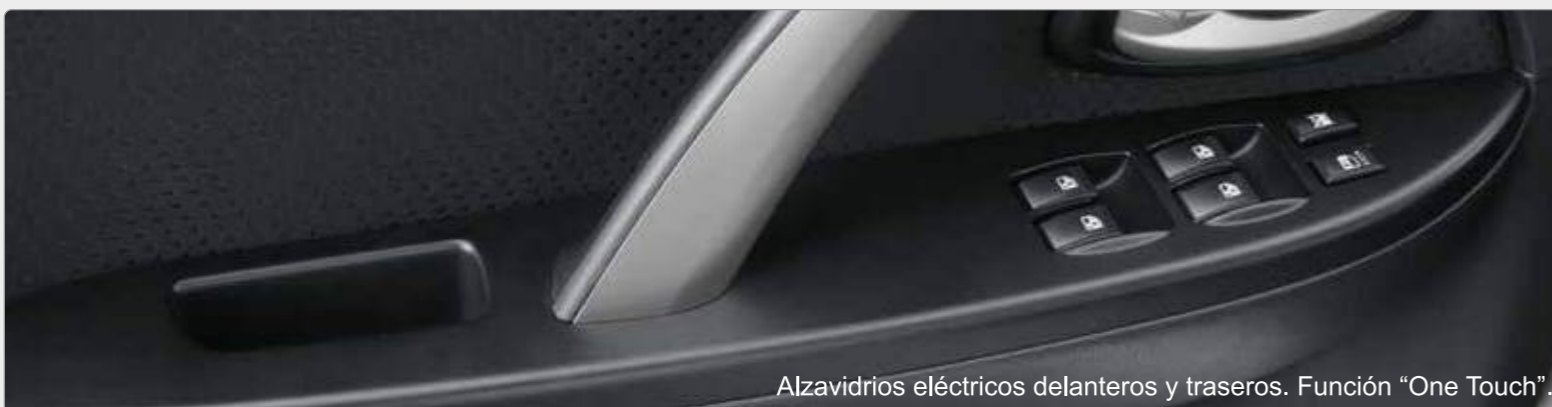
Alzavidrios eléctricos delanteros y traseros. Función "One Touch".