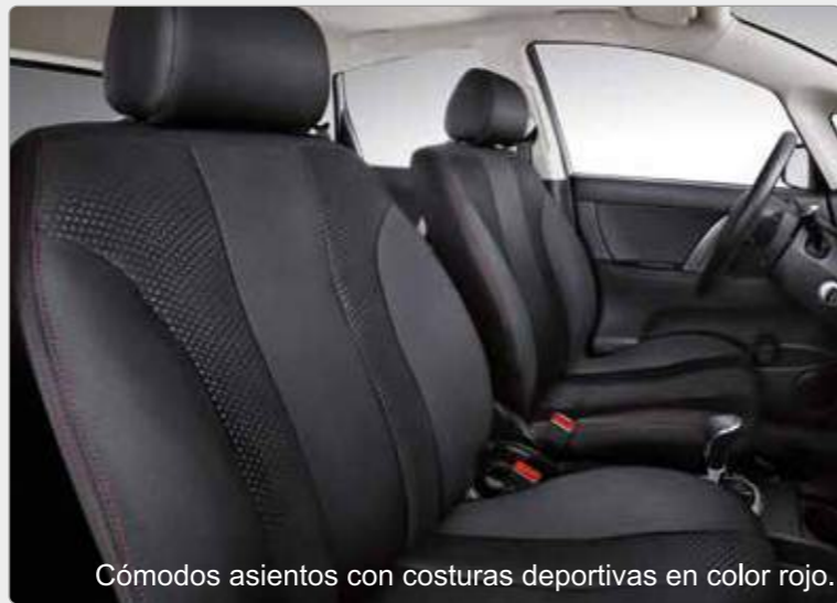
Cómodos asientos con costuras deportivas en color rojo.